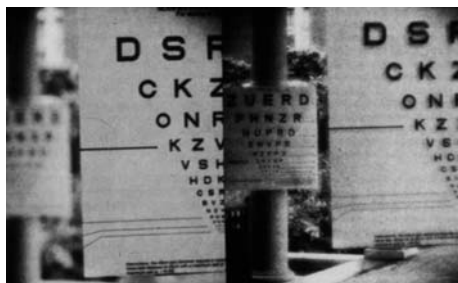
Abbildung 3: Photographische Simulation des Sehvermögens mit der natürlichen Augenlinse beim Blick in die Nähe (linkes Bild) und mit einer multifokalen Kunstlinse (rechtes Bild). Links ist die Sehzeichentafel in der Nähe scharf, die in der Ferne jedoch nicht lesbar. Rechts kann sowohl die Sehprobentafel in der Ferne als auch die in der Nähe gelesen werden, allerdings ist der Kontrast etwas geringer.

Multifokale Kunstlinsen ermöglichen durch diese Verteilung des einfallenden Lichtes auf mehrere Brennpunkte ein scharfes Sehen in allen Entfernungen, im Idealfall ohne jede Brille. Allerdings hat dieser Komfort auch gewisse Nachteile: durch die Verteilung des Lichtes auf mehrere Brennpunkte entsteht ein geringerer Bildkontrast. Das heißt, das Bild in dem Brennpunkt ist nicht ganz so scharf wie mit einer Brille (siehe Abb. 3), dafür sieht man aber ohne Brille. Wenn Sie eine Nahbrille (Lesebrille) nicht stört, bieten monofokale Kunstlinsen ein besseres Sehvermögen. Wenn Sie andererseits völlig auf eine Brille verzichten möchten, ist dies derzeit nur mit multifokalen Kunstlinsen möglich.