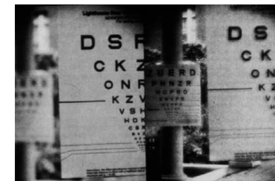
Abb. 2: Photographische Simulation des Sehvermögens mit der natürlichen Augenlinse beim Blick in die Nähe (linkes Bild) und mit einer multifokalen Kunstlinse (rechtes Bild). Links ist die Sehzeichentafel in der Nähe scharf, die in der Ferne jedoch nicht lesbar. Rechts kann sowohl die Sehproben tafel in der Ferne als auch die in der Nähe gelesen werden, allerdings ist der Kontrast etwas geringer.

Multifokale Kunstlinsen ermöglichen durch diese Verteilung des einfallenden Lichtes auf mehrere Brennpunkte ein scharfes Sehen in allen Entfernungen, im Idealfall ohne jede Brille. Allerdings hat dieser Komfort auch gewisse Nachteile: durch die Verteilung des Lichtes auf mehrere Brennpunkte entsteht ein geringerer Bildkontrast. Das heißt, das Bild in dem Brennpunkt ist nicht ganz so scharf wie mit einer Brille (siehe Abb. 2), dafür sieht man aber ohne Brille. Wenn Sie eine Nahbrille (Lesebrille) nicht stört, bieten monofokale Kunstlinsen ein besseres Sehvermögen. Wenn Sie andererseits völlig auf eine Brille verzichten möchten, ist dies derzeit nur mit multifokalen Kunstlinsen möglich.